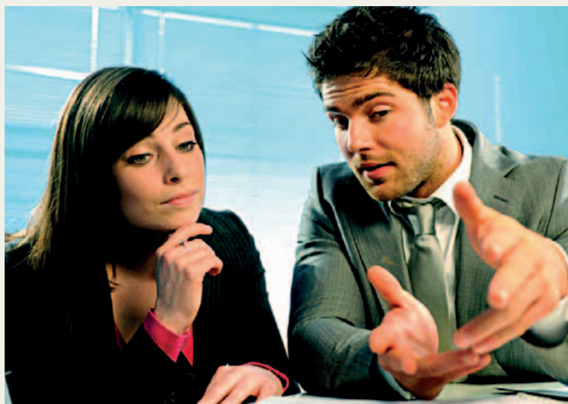
Nuevo enfoque. Muchas de nuestras viejas respuestas puede que ya no nos sirvan.

De la misma manera, podemos decir que nuestros pensamientos terminan el tipo de vida que llevamos.